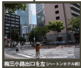
梅小路出口を左（ハートンホテル側）