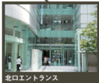
北口エントランス