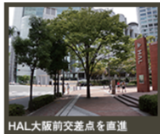
HAL大阪前交差点を直進