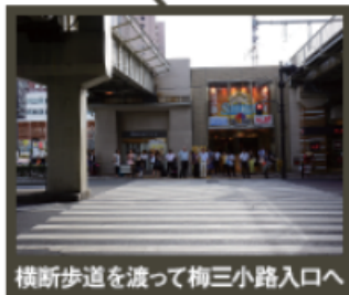
横断歩道を渡って梅小路入口へ